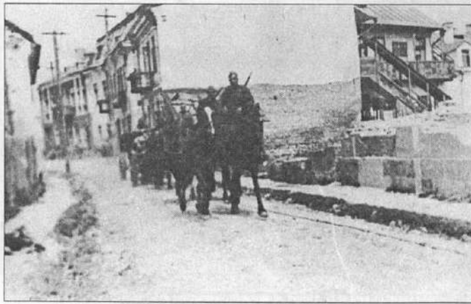
На улице освобожденного г. Гродно. 16 июля 1944 г. БГАКФД. № 0-19027