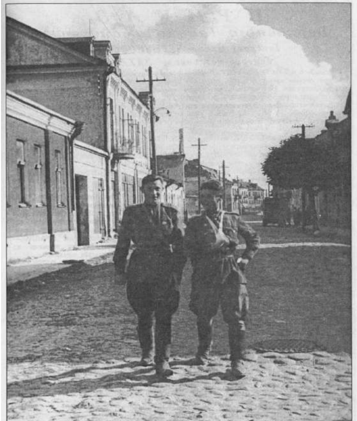
Офицеры Советской Армии на одной из улиц г. Гродно в день освобождения города от немецко-фашистских захватчиков. 16 июля 1944 г.